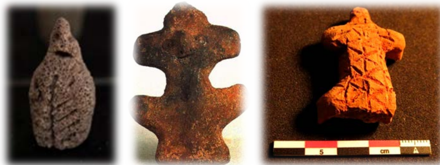
A la izquierda: Ídolo de Fuerteventura. Al centro: Guatimac (Tenerife). A la derecha: Ídolo de Gran Canaria. Todos ellos fueron encontrados en contextos distintos, como cuevas y barrancos.