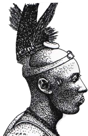
Tocado de una comunidad indígena de África

Abreu Galindo sólo recogió información tardía de los descendientes de los aborígenes de Lanzarote, moralizó su vestimenta, como hizo para otras islas, ya que llevar poca ropa era mal visto para la sociedad europea de aquel entonces. Parece ser que la descripción hace referencia únicamente a un segmento de la sociedad. Sin embargo, las excavaciones arqueológicas en la isla no han aportado información sobre restos de pieles, por lo que no se puede contrastar la información de los documentos escritos.