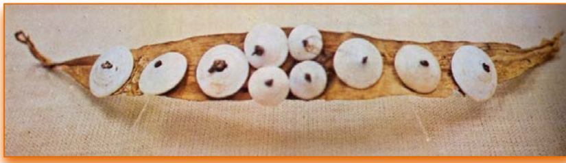
Diadema Barranco de Guayadeque. Gran Canaria.

Son de una morfología muy variada desde piezas cuadradas a cilíndricas, todas ellas con perforaciones que permitían ser engarzadas. En palabras del catedrático de Prehistoria, Antonio Tejera Gaspar: "Existe muy poca documentación sobre adornos en la Prehistoria de Lanzarote, ya que aunque se conocen numerosos objetos, hechos sobre todo en calcedonias o calcitas veteadas en diversos tonos marrones y en conglomerado de piedras y en caparazones de malacofauna, preferentemente de Conus y de ostrones, que en apariencia pudieran incluirse dentro de este grupo, se carece de datos precisos para explicarlos todos con esta función" .