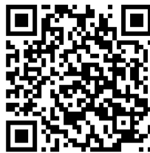
Video elaboración de una agua en hueso

Leonardo Torriani realizó varias ilustraciones que recogen el aspecto de los antiguos habitantes de las islas, en donde pueden apreciarse diferentes técnicas del tratamiento de la piel, unas conservaban los pelos y otras veces se trataba de cuero gamuzado.