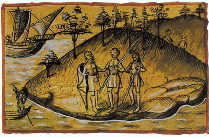
Ilustración de la crónica de la conquista, Le Canerien .

Según los textos, el uso del calzado en la sociedad de los antiguos habitantes de Lanzarote era por igual a todos los segmentos sociales, mientras que para la isla de Tenerife o Gran Canaria estaban reservados para una clase social. Al calzado se le denominaba mahos, la posibilidad del uso común de los zapatos puede ser una señal del posible rasgo de igualdad en ciertos aspectos de la sociedad aborigen de Lanzarote. No obstante, existen también descripciones del jefe de la isla, donde la vestimenta juega un papel de distinción: