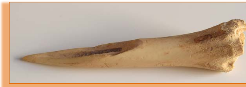
Punzón en hueso de ovicáprido. Peña de las Cucharas-Fiquinineo Siglos XIII-XIV

Entre los útiles óseos característicos de la cultura de los majos destacan sobre todo el registro encontrado de punzones en hueso de cabra, sobre huesos largos. Aunque existen escasos útiles sobre material óseo registrado por la arqueología en los yacimientos intervenidos en la isla, cabe suponer que en futuras excavaciones arqueológicas aparezcan datos sobre este tipo de registro material de uso cotidiano en las vidas de los majos, conociendo mejor cómo trabajaban esta materia prima. Los estudios también permitirán arrojar luz sobre la variabilidad de sus usos para el día-día de estas poblaciones. La mayoría de los huesos trabajados procede de los cuartos traseros de cabras y ovejas, también pueden ser de cerdos, mamíferos marinos, y aves.