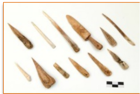
Registro óseo de la isla de La Palma. Portapunzones.