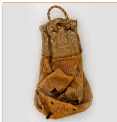
Bolsa de piel procedente de Gran Canaria.

Aparte de los odres y cueros en la contención y transporte de la leche y la cebada, tal como citan algunos textos sobre las crónicas de la conquista, utilizaban zurrone de piel de cabra y bolsas de cuero gamuzado. El zurrón era especialmente empleado, tal como se ha conservado hasta nuestros días, para guardar el gofio después de haberlo amasado en el propio zurrón. En Lanzarote se utilizaba también un tipo de zurrón para guardar los dardos y otro más pequeño para las piedras arrojadas. Además de los zurrone, parece que se empleaban unas bolsitas de cuero gamuzado como estuche de algunas menudencias.