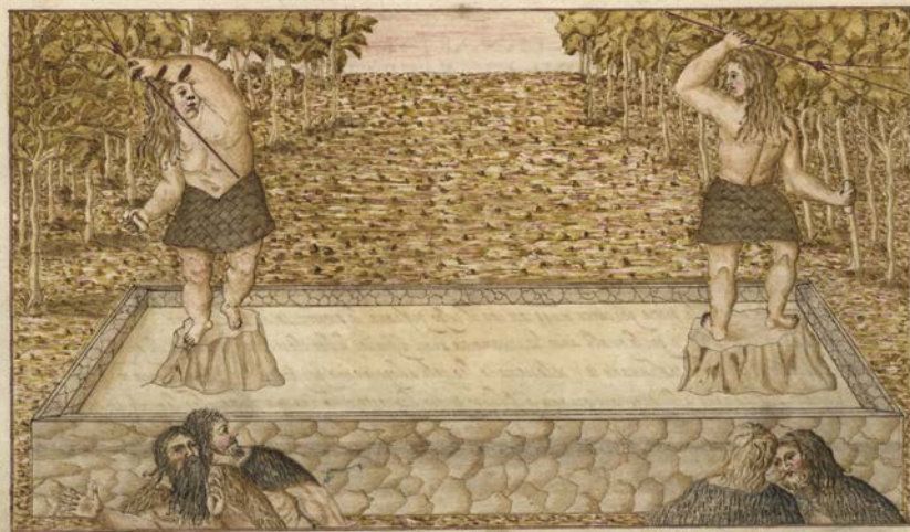
Dibujo de L. Torriani

“Se vestían con pieles de ovejas cosidas con hilos muy delgados, hechos con el mismo cuero, a modo de cuerdas de laúd. En lugar de agujas tenían ciertos huesos de cabras y espinas muy agudas que trabajan con suma industria” L. Torriani.