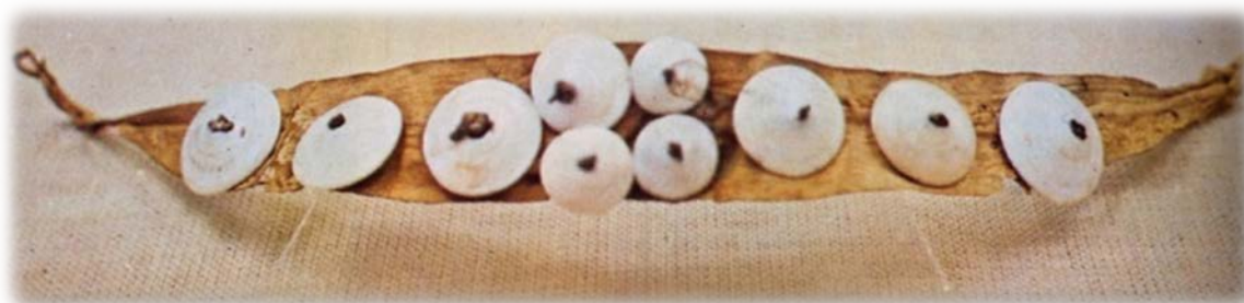
Diadema de cuero y conchas (Gran Canaria)