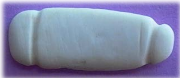
Placa de concha con ranuras

En los yacimientos arqueológicos de Lanzarote se han recuperado distintas piezas que debieron pertenecer a la vestimenta y adornos de los majos. Ejemplo de ello son las cuentas de collar elaboradas con conchas, lapas con perforaciones que debieron ser colgantes o estar cosidas a las vestimentas, como dicen las crónicas que “...tenía el rey Guadarfía un bonete como mitra de dos puntas de cuero de cabrón, sembrado a trechos de conchas de mar...” (Marín y Cubas (1986).