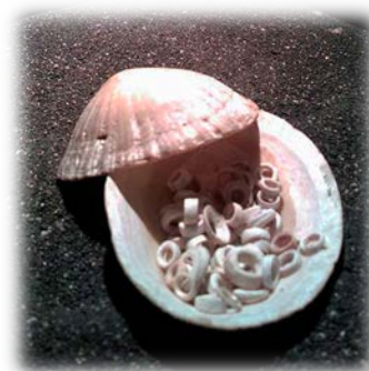
El joyerito (Tenerife)