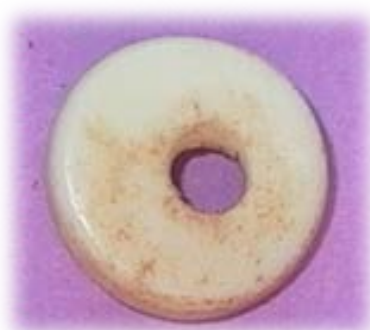
Cuenta de collar de concha

De otra parte, también se cree que pudieron tener algún valor simbólico y relacionado con el mundo de las creencias (amuletos por ejemplo), ya que a veces se han descubierto en lugares apartados y escondidos, como pueden ser las cuevas.