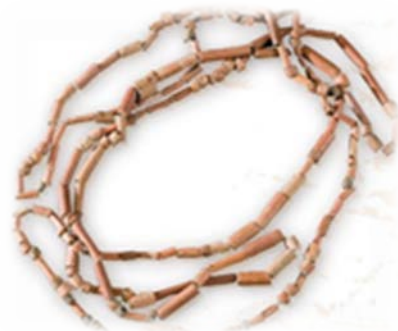
Collar de cuentas de barro (Tenerife)