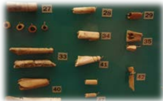
Cuentas y adornos de hueso (La Palma)